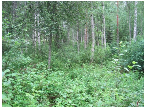
Kuva 90. Kakaravaaran vehmasta puistikkoa

Taajaman itäpuolella Paikkalanvuoren juurella louhikkoisessa Vanhan pappilan puron varressa on vanhempaa puustoa: mäntyjä, koivuja, tervaleppää Alnus glutinosa ja haapoja. Pensas- ja