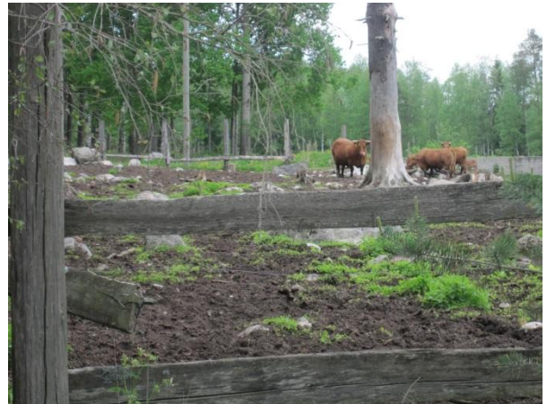
Kuva 19. Karjaa aitauksessaan, Salokas

Kuoppalan ja Vuojärven itäpuolella läheisestä OMT -tyypin kuusivaltaisesta metsästä sekä pellon sekametsäniemekkeestä löytyi liito-oravan lisääntymis- ja levähdyspaikka 3.6.2014. Tästä olivat merkinä lukuisat papanarykelmät haapojen ja kuusten juurella. Rajauksessa on myös kolohaapoja. Esiintymä on rajattu karttaan ( liito2, kaksi osa-aluetta ja kulkuyhteys ).