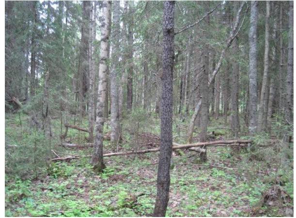
Kuva 5. Pirttilän ja Kallioperän välistä vanhempaa metsää

Kallioperän itäpuolella on puoliavoimia ojanvarsipensaikkoja ja kuusitaimikko, josta löytyy muun muassa maitohorsma, mesiangervo Filipendula ulmaria , karhunputki Angelica sylvestris , huopaohdake Cirsium helenioides ja vadelma Rubus idaeus . Kallioperän ympärillä ja pohjoispuolella Piukunnorossa on puolukka-(CT) ja mustikkatyypin (VT) havupuultaista metsää, harvennusta ja pieniä uudistusaloja. Paikoin löytyy myös koivua ja haapaa Populus tremula kasvavaa käekaali-oravanmarjametsätyyppiä (OMT) ja lahopuuta. Metsä on monirakenteista ja metsätyytit menevät limittäin, joten selkeiden rajojen tekeminen on vaikeaa.