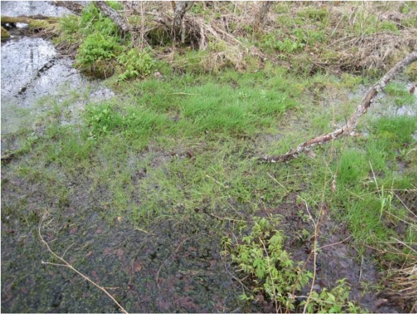
Kuva 53. Karvalin lähde