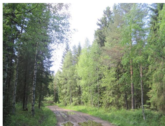
Kuva 31. Myllykankaantien varren metsää