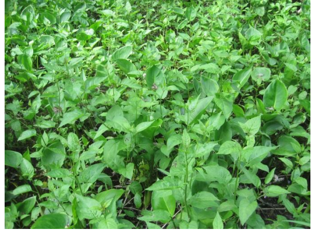
Kuva 66. Saarisen rannan punakoiso