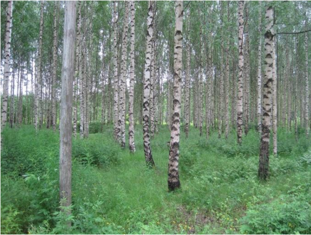
Kuva 71. Janholan pellonreunakoivikko