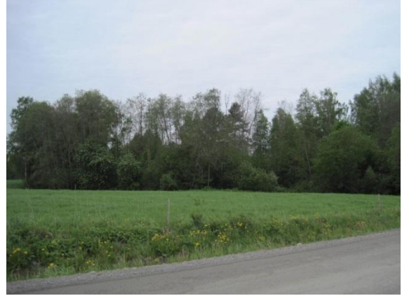
Kuva 17. Mustalammen puron varsi ja Saarisen rantalepikkoa