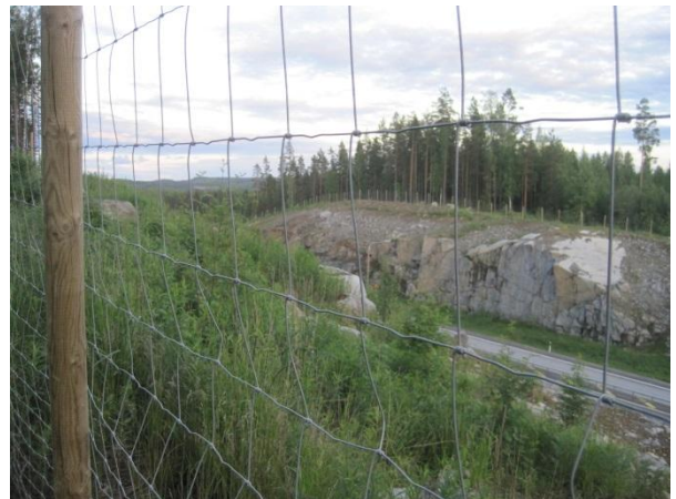
Kuva 118. Paasivuoren eteläosa, johon on louhittu valtatie 4.