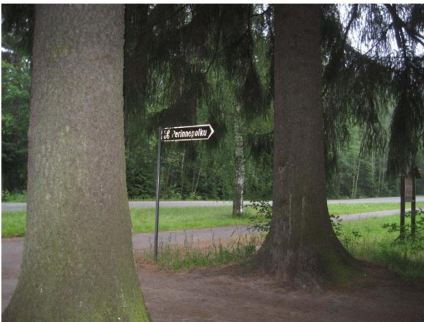
Kuva 91. Vanhan pappilan komeat kuuset

Puron varren linnustoon kuuluvat mustapääkerttu, lehtokerttu, pajulintu, punarinta, peippo, viherpeippo Carduelis chloris ja punatulku Pyrrhyla pyrrhyla .