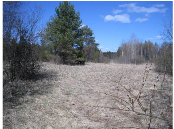
Kuva 50. Koivulehdon niittyä toukokuussa

Karvalin metsän läpi virtaa metsälain mukainen kohde , kivikossa loriseva Kouvolanoja , joka Karvalin kohdalla luo monimuotoisuutta metsäalueeseen, ja jota reunustavat suuret kuuset. Tämä pienvesi on ilmeisesti aikoinaan pengerrytetty ja peltojen kohdalla se virtaa hyvin ojamaisena.