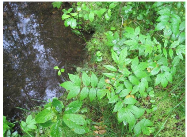
Kuva 102. Kärmevuoren lähde