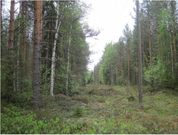
Kuva 4. Piukunnoron mäntyvaltaista sekapuustoa