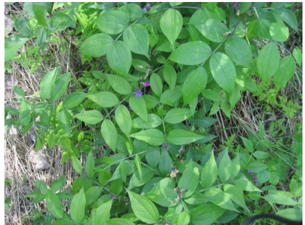
Kuva 84. Kevätlinnunherne

Sikoviidan rantamökeistä itään on mäntyvaltaista metsää, joka sisempänä muuttuu kuusivaltaisemmaksi, josta ojan varresta löytyi liito-oravan elinpiiri (liito6) 5.6.2014. Paikoin löytyi runsaasti papanoita haapojen ja kuusten juurelta. Lisäksi rannan lintulajistosta mainittakoon rantamäntyjen yläpuolella varoitteluva nuolihaukka.