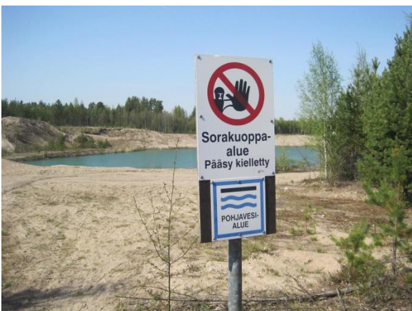
Kuva 42. Ristiriistaista maankäyttöä soranotto- ja pohjavesivaranto

Syrjäharju on pääosin ollut soranottoalueena, vaikka sijaitsee tärkeällä I luokan pohjavesialueella . Sorakuoppa on maisemavaurio ja sen keskellä on ilmeisesti pohjaveteen asti ulottuva lampi. Lammen rannoilta löytyi pesivä rantasipi.