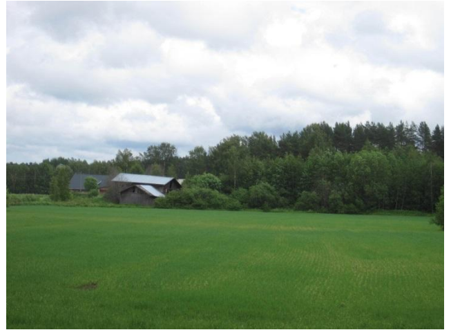
Kuva 72. Läsän ulkorakennuksia, peltoa ja takametsää

Läsä on peltojen ympäröimä tila Saarisen eteläpuolella. Tilan yhteydessä on pieni metsäsaareke, jonka reunoilla on myös omakotitaloja. Läsän ulkorakennusten luona on kalliokumpare, jossa on ketomaista ympäristöä. Lajisto on tavanomaista ja sen perusteella on havaittavissa rehevöitymistä. Kalliolla kasvaa sammalten lisäksi tuomi, poimulehti Alchemilla sp. , metsäkurjenpolvi, ahomansikka, nurmitädyke, niittyleinikki, herukka, vadelma, mesiangervo ja koiranputki. Pienellä hoidolla kedosta saisi edustavamman.