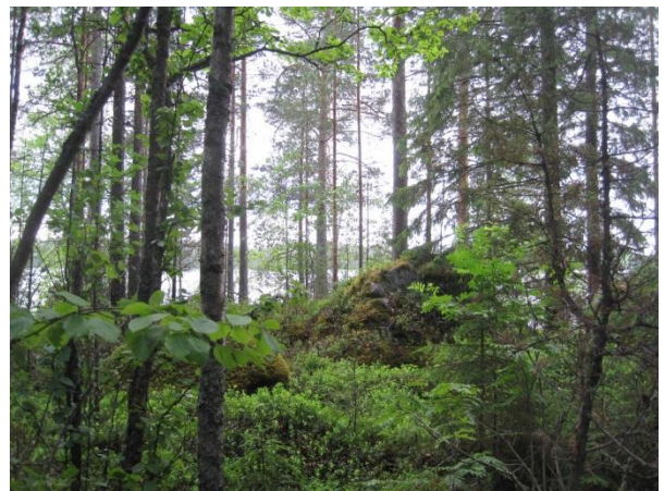
Kuva 25. Saarisen louhikkoista rakentamatonta etelärantaa

Tämän kaavan koillislaidassa kulkee Hamperinjoki (alle 2 km), joka laskee Maunosesta Aittojärveen . Joenvarsi on harvaan rakennettu: joitakin kesämökkejä, jokunen asuintalo sekä vanha mylly ja Toivakan puutarhat. Joen yli kulkee kolme tietä pienten siltojen kautta: Pihtiniityntie, Myllykankaantie ja Jokelantie .