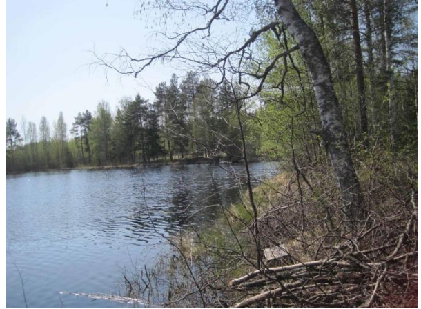
Kuva 41. Lamminsuonlampi, taustalla näkyy myös rantapeltoa

Tämän työn selvitysalue rajautuu idässä maisemallisesti hienoon Konttikallioon .