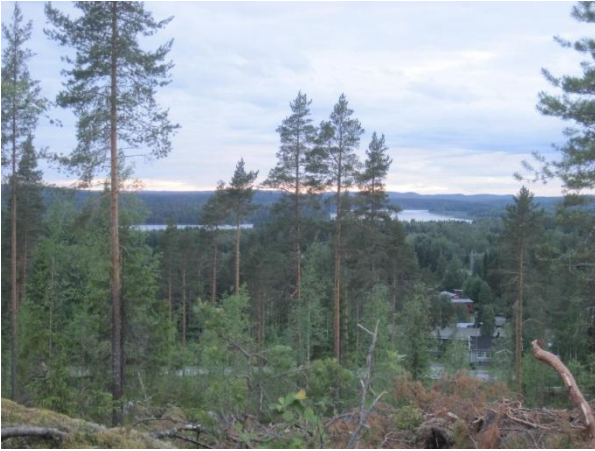
Kuva 99. Uusi hakkuu avaa Kiikarvuorelta näkymät Leppävedenrantaan.

Hakkuusta johtuen linnusto vuorella oli vähäinen: käpytikka, metsäkirvinen ja keltasirkku.