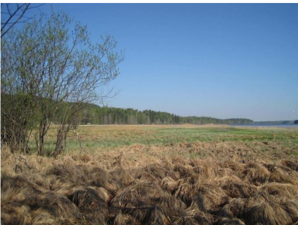
Kuva 107. Pohjoonlahden pohjan laaja rantakosteikko