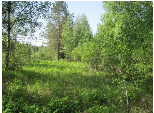
Kuva 75. Luhtaista pensaikkaa Ajakanojan varressa