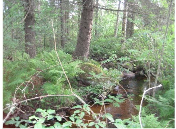
Kuva 116. Laskukallion ohi kulkeva kirkasvetinen puro, joka muuttuu etempänä Hietakosken puroksi

Paasivuori kuuluu vain eteläosaltaan tähän osayleiskaava-alueeseen. Paasivuori on pääosin havupuuvaltaista metsäaluetta, joka kohoaa korkeimmillaan yli 166 metrin korkeuteen merenpinnan yläpuolelle ympäröivää maisemaa hallitsevasti etenkin Leppävedenrannasta päin katsottuna. Paasivuori sijaitsee vanhan Jyväskylätien (644) ja uuden valtatie 4. (E75) välissä, jonne uuden tien liikenteen melu kuuluu selvästi. Vuoren laelle kulkee metsäautotie ja rinteillä on laajalti tehty hakkuita. Vuoren eteläosa on havupuuvaltaisen puolukka-mustikkatyyppin metsän peitossa, jossa joukossa kasvaa myös lehtipuuta. Alempana rinteillä on rehevämpää käenkaali-oravanmarjatyyppin kuusikkoa. Pellon laidoissa ja tienvarsilla on enemmän lehtipuuta. Itärinteessä on karumpaa kanerva- ja poronjäkälatyyppin männikköä. Yleensäkin Paasivuori on hyvin louhikkoista ja rinteistä löytyy näyttäviä siirtolohkareita. Metsäautotien penkassa kasvoi yksittäinen valkolehdokki ja muualla metsässä kasvaa mm. metsävirnaa. Uusi valtatie 4 on louhittu Paasivuoren etelärinteeseen ja tie on varustettu riista-aidalla.