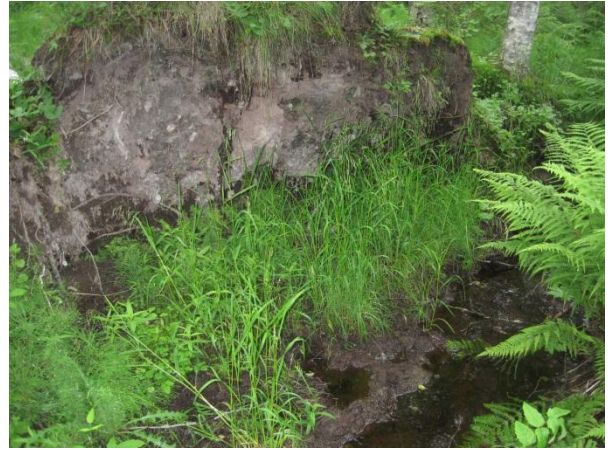
Kuva 130. Juurakon suojissa kasvava korpisorsimo

Uutelan ja Tapiolan välissä on rehevä luonnon monimuotoisuuden kannalta tärkeä puronvarsi ( luo1 ). Puro alkaa Järvi- ja Vaarinsuon ojista ja se laskee kohti Pohjoonlahtea menevää puroa. Puron varressa lähellä Kylkipirtintietä on varttunutta koivikkoa, jossa kasvaa muun muassa maakunnallisesti uhanalainen korpisorsimo, lehtotesma, soreahiirenporras ja salokeltano Hieracium sp. ( luo1 ).