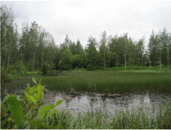
Kuva 87. Kakaravaaran asuntoalueen lampi

Vanhan pappilan puro laskee asuntoalueen keskellä olevaan pieneen lampeen, josta puro jatkaa matkaansa Malviharjun kautta Pohjoonlahteen . Lampi näyttää tulvivan aika ajoin. Tästä on merkinä kuolleita kuusia. Lammen rannalla kasvaa rahkasammalta ja rehevää kasvillisuutta: korpi-imarre, kiiltopaju, vehka, ratamosarpio, mesiangervo, suo-orvokki, metsäruusu, niittyleinikki, rantamatara, korpikaisla, pitkäpääsara, pullosara ja valkopiirtoheinä Rhynchospora alba . Vedessä kasvaa saroja, järvikorte ja vesikuusi Hippuris vulgaris . Kesäkuun lopussa lammella uiskenteli telkkä kahden poikasen kanssa.