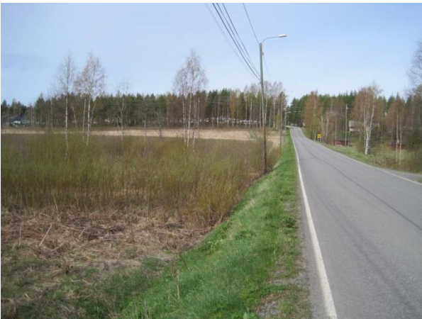
Kuva 47. Paikkalankangas ja Varikontie kirkonkylän suuntaan

Paikkalankankaan pellot ovat osin viljelyssä ja osin kesantona. Paikoin pellon oja on kaivettu ja metsikköjen reunoilla näkyi maa-ainekasoja. Pellolla oli pariskunta kurkia Grus grus 15.5.2014. Karvalin ja Koivulehdon välinen metsä on reheväkasvuista ja useampi puulajista. Sieltä löytyy niin vanhempaa kuusikkoa, nuorta haapaa, koivikkoa, harmaalepikkoa kuin istutettua mäntyäkin. Osa metsistä on entisiä peltoja, joissa pensaskasvillisuutena on paikoin runsas vadelma. Metsien aluskasvillisuus on vaihtelevaa ja rehevää: kataja, ahomansikka, metsäimarre, metsäkorte, käenkaali, nokkonen Urtica dioica , metsäälvejuuri, sudenmarja, oravanmarja, puna-ailakki Silene dioica , herukka, vadelma ja heinistä mainittakoon yleinen metsäkastikka.