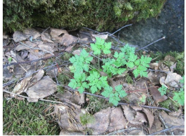
Kuva 126. Haisukurjenpolvi

Utelassa löytyy kivikkoinen kallionaluslehto ja muutoinkin ”Baijerin laakson” metsärinteet ovat kivikkoisuudestaan lehtomaisia ja muistuttavat paljon Päijänteen rantoja. Kallionaluslehdosta löytyy paikallisesti edustavia kasveja : kivikkoalvejuuri Dryopteris filix-mas , isoalvejuuri Dryopteris expansa , lehtokuusama, lehto-orvokki, lehtomatara Galium trifolium , mustakonnanmarja Actaea spicata ja lehtopalsami Impatiens noli-tangere . (luo1)