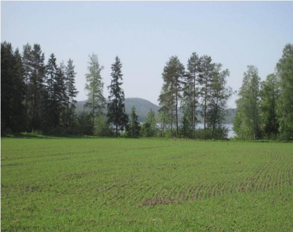
Kuva 77. Leppävedenrantaa