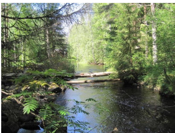
Kuva 28. Puinen pikkusilta Hamperinjoella