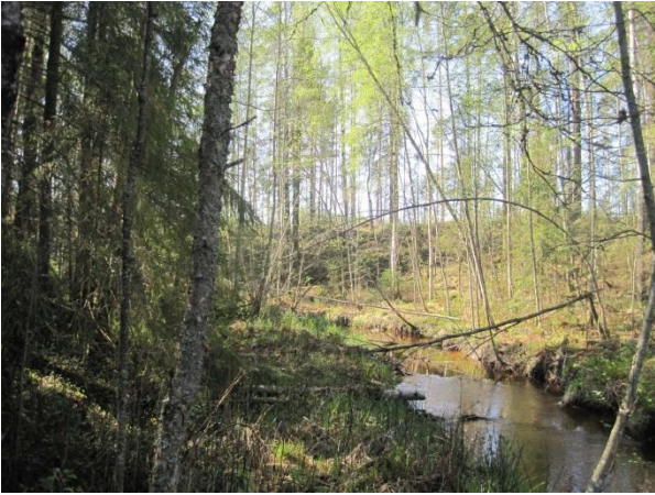
Kuva 109. Hietakosken puron läheinen hakkuu on hieman muuttanut puron varren pienilmastoa.