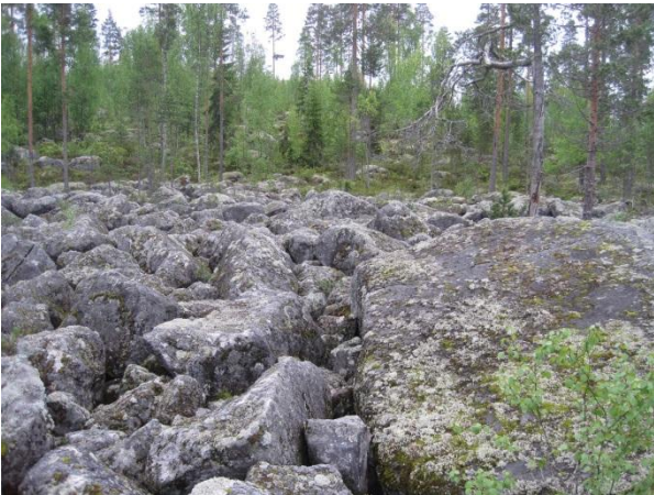
Kuva 123. Kylkissuon läheistä ”pirunpeltoa”