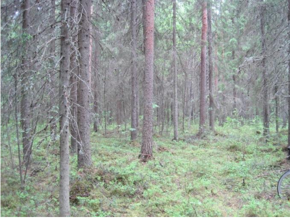
Kuva 20. Kuoppalan ympäristön metsää