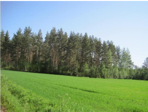
Kuva 79. Leppävedenrannan pelto ja männikkömaisemaa