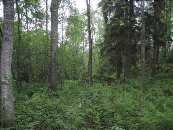
Kuva 127. Kivikkoista kallionaluslehtoa

Utelassa löytyy kivikkoinen kallionaluslehto ja muutoinkin ”Baijerin laakson” metsärinteet ovat kivikkoisuudestaan lehtomaisia ja muistuttavat paljon Päijänteen rantoja. Kallionaluslehdosta löytyy paikallisesti edustavia kasveja : kivikkoalvejuuri Dryopteris filix-mas , isoalvejuuri Dryopteris expansa , lehtokuusama, lehto-orvokki, lehtomatara Galium trifolium , mustakonnanmarja Actaea spicata ja lehtopalsami Impatiens noli-tangere . (luo1)