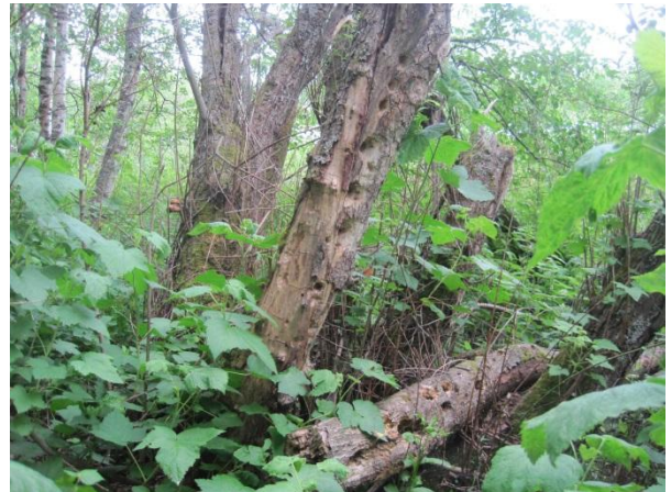
Kuva 68. Betonitehtaan rantapensaikko