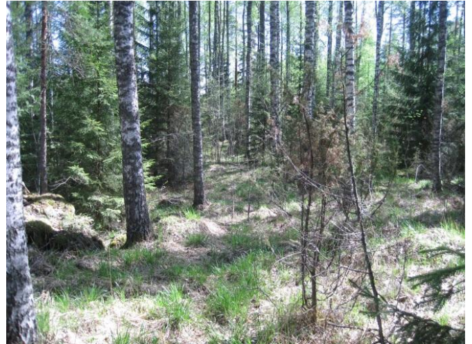
Kuva 114. Rajamäen valoisa metsäsaareke

Rajamäen ympärillä olevien peltojen väliin jää monipuolisia osin hakamaisia metsäsaarekkeita, joissa osassa pääpuuna on koivu ja osassa mänty tai kuusi. Rajamäen tilan pihapiirin ympäriltä löytyi myös liito-oravan papanoita suuren kuusen alta 22.5.2014 ( liito17 ). Rajamäen ja Kujalan pihapiireistä olisi ehkä saattanut löytyä lisää merkkejä liito-oravasta. Pihoja ei tutkittu.