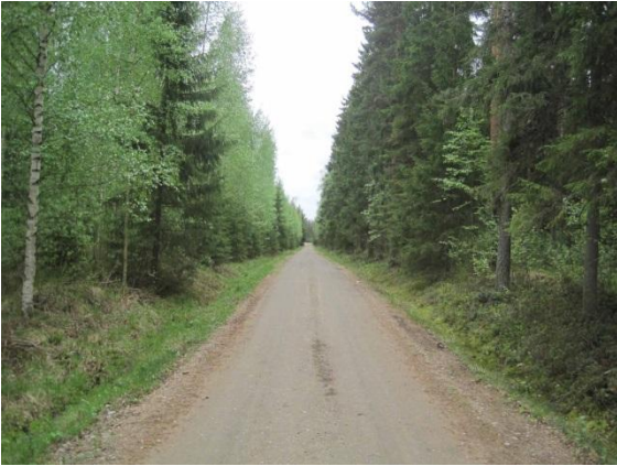
Kuva 6. Pirttiläntie