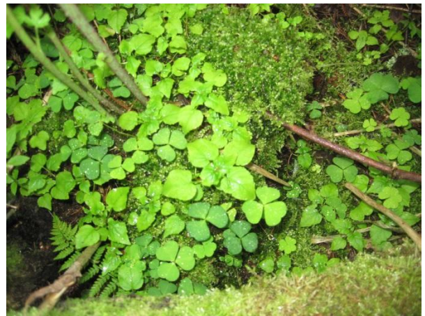
Kuva 92. Velholehti käenkaalin joukossa