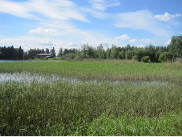
Kuva 36. Aittojärven pohjoispää