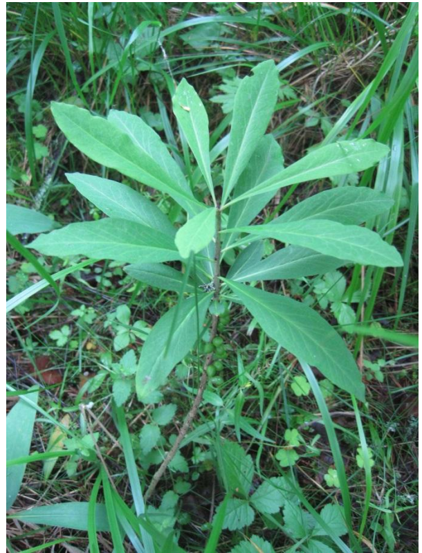
Kuva 70. Näsiä