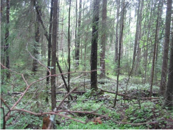
Kuva 22. Hamperinjoen itäpuolista metsää, kuusta