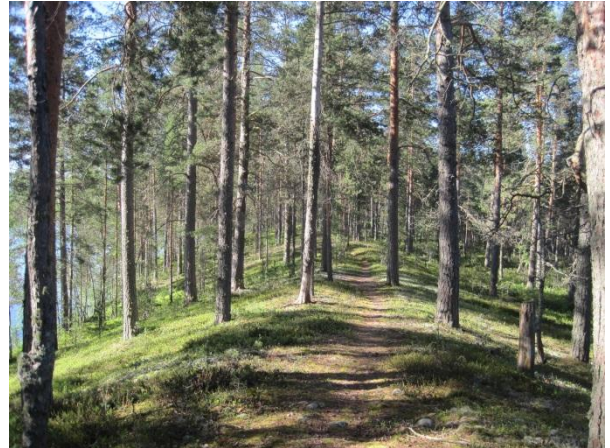
Kuva 3. Maunosen ja -suon välinen maisemakannas