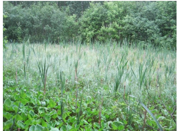
Kuva 86. Pölkin umpeenkasvanut lampi