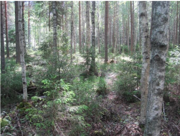
Kuva 24. Pikkusieppometsä