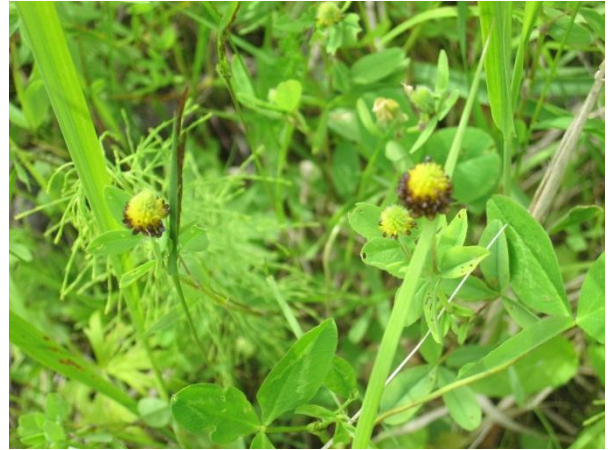
Kuva 62. Silmälläpidettävä musta-apila