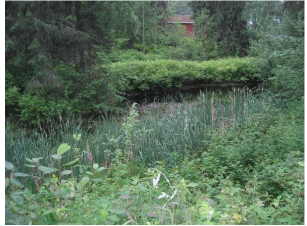
Kuva 94. Vanhan pappilan lammikko

Malviharjun tien ja Viisarinmäentien (618) kulmaan jää varttuneiden puiden metsäsaareke, jossa kasvaa rauhoitettua valkolehdokkia yli kymmenen yksilöä. Valitettavasti esiintymää uhkaa tienvarteen kasatut maakasat ja juurakot ( luo1 ).