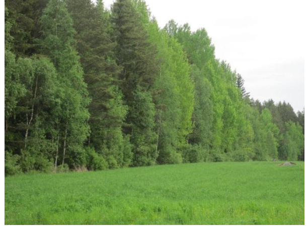
Kuva 21. Liito-oravametsäniemeke Vuojärven koillispuolella

Läheisellä Harjulan pellolla oli ruisrääkkä Crex crex ja laidunsi yksinäinen laulujoutsen Cygnus cygnus . Pohjoisempana koivukummun pellolla lauloi pensastasku Saxicola rubetra .