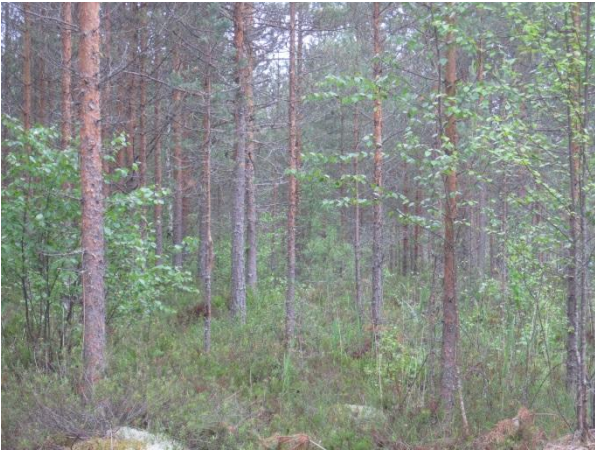
Kuva 121. Järvisuon rämettä

laulurastas ja kulorastas. Kylkisniitulla havaittiin pellolla rupikonna Bufo bufo 23.5.2014. Kylkisniitulla kukki jonkin verran mesimarja. Komealupiinikin oli leviämässä metsätien varressa.