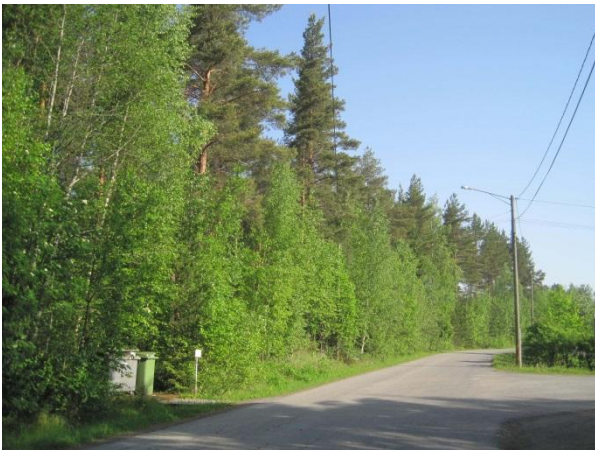
Kuva 74. Metsää Ahokkaan asuinalueen pohjoislaidassa

Raivionmäen itäpuolella pellon keskellä on oravanmarja-mustikkatyypin metsäsaareke, jossa kasvaa sekä havu- että lehtipuuta. Raivionmäellä on myös laajoja taimikkoja ja aivan uusia hakkuita. Raivionmäen länsipuolella pellon laidassa on istutuskoivikko, jonka pohjoisosassa on pala puoliavointa pensaikkaa ja luhtakoivikko, jossa on runsas mesiangervo- ja maitohorsmakasvusto. Koivikon laidassa Nikkarinlahteen laskee pieni vaatimaton ojamainen puro Ajakanoja . Itäpuolella peltoa voimalinjan alla on kostea pensaikko, jossa viihtyi muun muassa pensaskerttu, lehtokerttu ja metsäkirvinen Anthus trivialis . Tuulensuun pellolla pesi ainakin töyhtöhyppä Vanellus vanellus ja Ahokkaan pohjoispuolella sirisi pellolla pensassirkkalintu Locustella naevia 5.6.2014. Raivionmäen linnusto on melko harvaa: tiltalti, laulurastas, hernekerttu ja peippo.