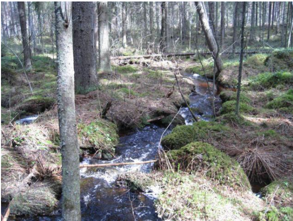
Kuva 51. Kouvolanoja

Etelämpänä yläjuoksulla Paloisentien varressa Kouvolanoja virtaa vanhemman kuusikon sisällä koskimaisesti (paras osa jää tästä kaavasta ulos) ja välillä tiheään taimikon sisällä sekä ennen peltoja myös uuden hakkuun laidassa. Tällä osin kasvillisuudesta mainittakoon Kouvolanojan varresta lehtomaisuuden ilmentäjä kotkasiipi Matteuccia struthiopteris .