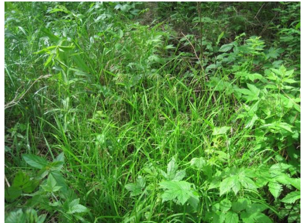
Kuva 35. Korpisorsimo Kominojan kosteikolla