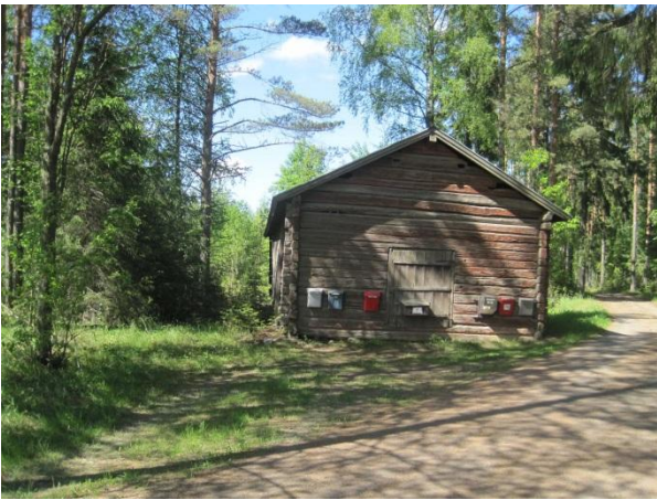
Kuva 18. Idyllinen ulkorakennus, Salokas