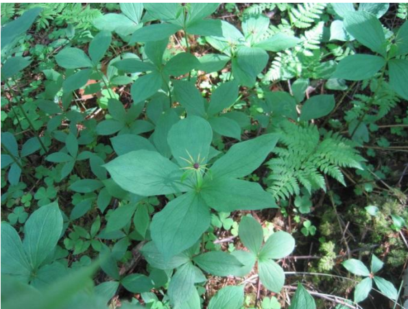
Kuva 83. Eräs yleinen lehdonilmentäjälaji: sudenmarja