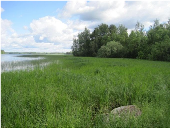
Kuva 95. Pohjoonlahden ranta Vehmaan kohdalla

Lähempänä rantaa löytyy liito-oravan papanoita kuusten juurelta läheltä rantamökkiä 19.6.2014 ( liito9 ).