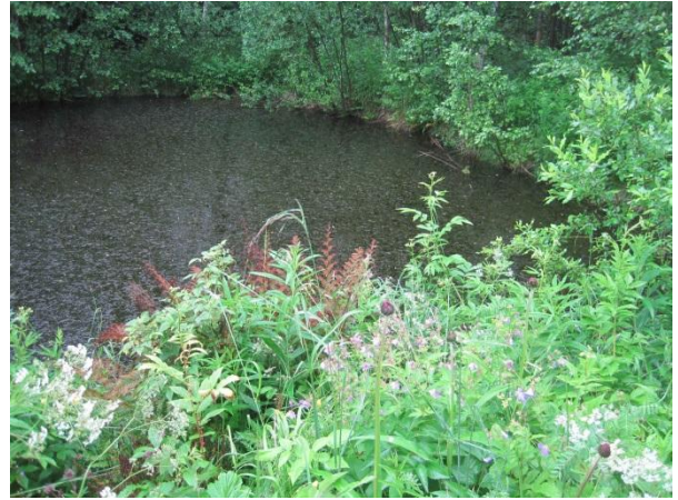
Kuva 54. Isonäkinsammallammikko

Kouvolanojan, Koivulehdon ja Karvalin seudun metsissä ei havaittu merkkejä liito-oravasta toukokuussa 2014. Aivan pihapiirejä ei tutkittu.