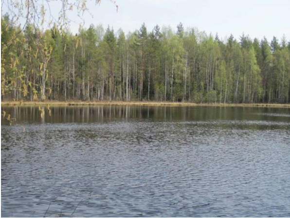
Kuva 40. Lamminsuonlampi

Lampea ympäröivät laajat nuorten metsien (kuusi, koivu) alueet. Itäpuolella on ojitettua rämemetsää.