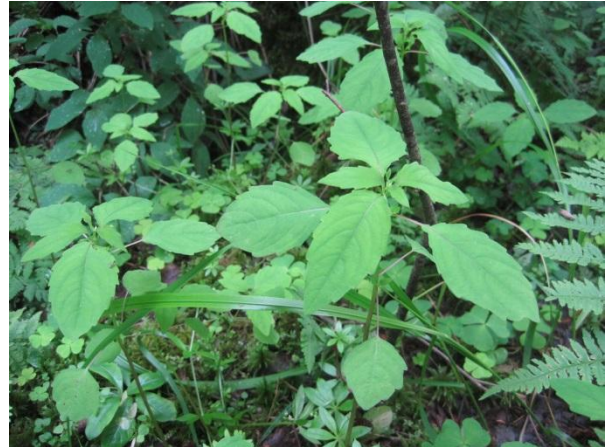
Kuva 128. Lehtopalsami