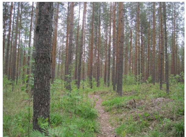
Kuva 12. Särkänkangas