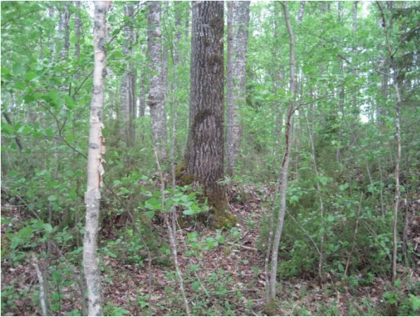
Kuva 57. Saarisen länsirannan metsikkö