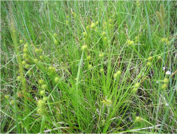
Kuva 61. Keltasara: ei uhanalainen, mutta havaintona huomionarvoinen