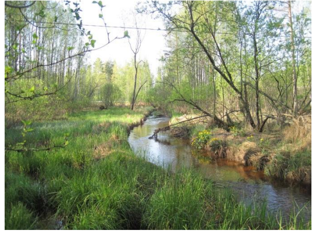
Kuva 106. Pohjoonlahden virtaava leveä puro