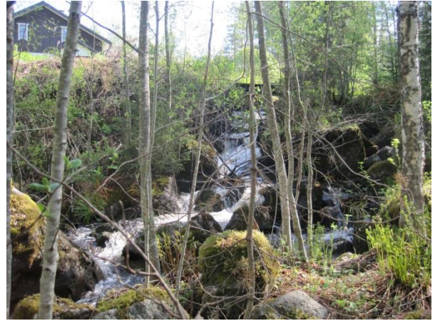
Kuva 110. Hietakoskenpuron koskimainen osuus

Hietakosken puron varressa on suurta puustoa: kuusta, koivua, haapoja ja mäntyjä. Harjupuron eteläpuolella on tuore hakkuu, johon on jätetty siemenpuuksi mäntyä. Hietakoski-puron varresta löytyy runsas ja paikallisesti merkittävä kasvilajisto: velholehti, korpisorsimo , kotkansiipi, metsäkorte, kangaskorte, lehtotesma, korpi-imarre, käenkaali, soreahiirenporras, mesiangervo, suo-orvokki ja kielo. Puronotkon reunoilla kasvaa suuria kuusia, mäntyjä sekä lehtipuuta – joukossa myös kolo- ja lahoppuuta. Paikoin puronvarsi on varsin pensaikkoista ja hankalakulkuista. Puronvarteen on uhkaavasti leviämässä pihoista jättipalsami ja pihlaja-angervo, jotka ovat uhka muun muassa korpisorsimon säilymiselle alueella. Puron ylittää rantamökeille menevän tien silta, jonka länsipuolella on koskimainen puro-osuus. Puron meanderimaisessa mutkassa on myös vehkaa kasvava lammikko.