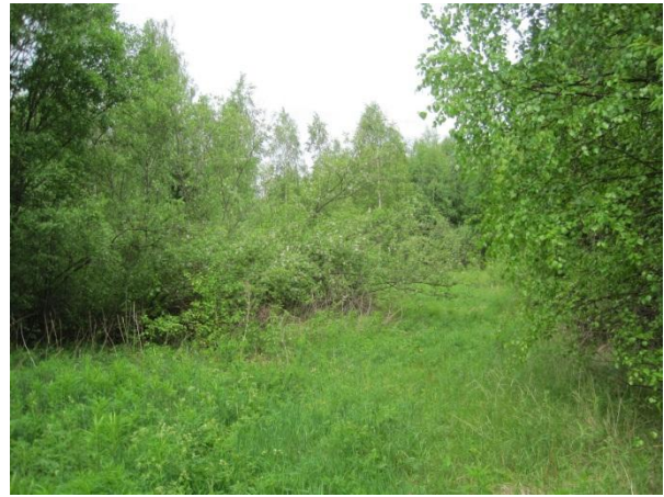
Kuva 56. Sahijoen itäpuolen pensaikkaa lähellä Vuojärveä.

Särkätien varressa tilalle päin mentäessä on pienialainen OMT- sekametsäsaareke, jonka reunaosissa on viljelyalueen reunoille tyypillistä harmaalepikkoa, jossa kasvaa ainakin nokkonen, metsäimarre, metsäalvejuuri ja vadelma.