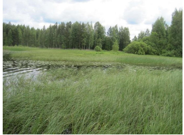
Kuva 37. Aittojärvi Kominiojan suu