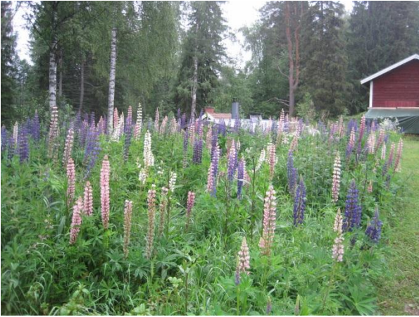
Kuva 93. Komealupiini valtaa alaa