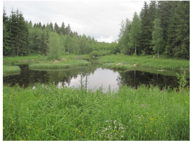
Kuva 96. Vehmaan vesilintulammikko

Pohjoonlahden itärannassa on reheviä metsiä. Osa metsistä on lehtomaista oravanmarjäkänkaalityypin kuusikkoa ja osa lehtipuuvältaista sekä lisäksi on myös haaparyhmiä, harmaalepikkoa ja pensaikkoja. Etenkin rakentamattomista osista rantaa löytyy runsasta pajukkoa ennen rannan saraa kasvavaa luhtaa ja vedessä kasvavaa järviruovikkoa. Metsiköiden kasvillisuudesta löytyy joukosta isoja haapoja, pihlajaa, ahomansikka, metsäruusu, sudenmarja, metsäorvokki, nuokkuhelmikkä ja metsäalvejuuri. Rantaluhdassa kasvaa ainakin luhtalemmikki, luhtasara, pullosara, jokapaikansara ja viiltosara.