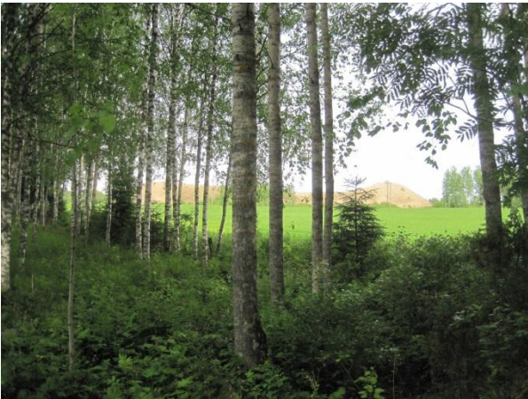
Kuva 34. Syrjäharjun sorakasat peltomaisemassa