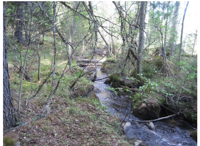
Kuva 113. Sivinmatinmutkan puro, joka muuttuu matkalla Hietakoskeksi