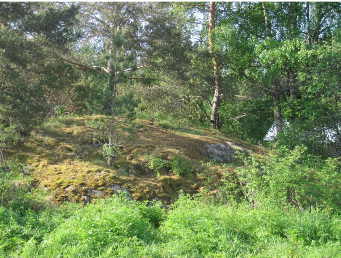
Kuva 73. Läsän rehevöitynyt kallioketo

Läsä on peltojen ympäröimä tila Saarisen eteläpuolella. Tilan yhteydessä on pieni metsäsaareke, jonka reunoilla on myös omakotitaloja. Läsän ulkorakennusten luona on kalliokumpare, jossa on ketomaista ympäristöä. Lajisto on tavanomaista ja sen perusteella on havaittavissa rehevöitymistä. Kalliolla kasvaa sammalten lisäksi tuomi, poimulehti Alchemilla sp. , metsäkurjenpolvi, ahomansikka, nurmitädyke, niittyleinikki, herukka, vadelma, mesiangervo ja koiranputki. Pienellä hoidolla kedosta saisi edustavamman.