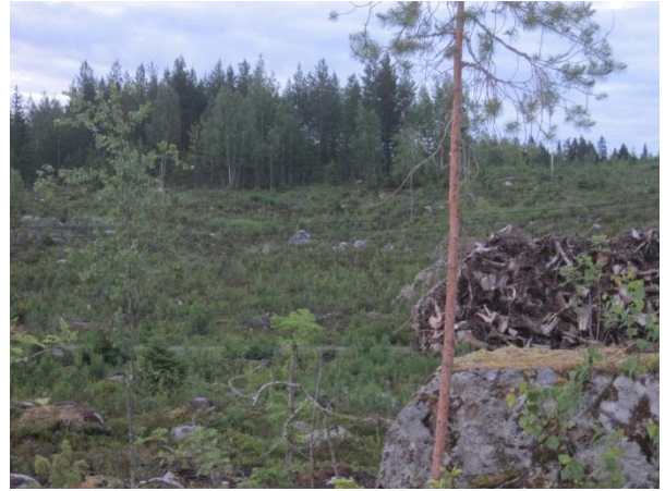
Kuva 100. Kiikarvuoren laajaa avointa taimikkoa

Kiikarvuoren lounaispuolella sijaitsee yhteiseen metsä- ja maisema-alueeseen kuuluva Kärmevuori , joka on pääosin puolukka- ja mustikkatyypin louhikkoista mäntykangasta. Pohjoispuolella on yksi asuintila ja metsittynyt soramonttu ja lähde. Avovetisen lähteen (metsälain kohde, luo1) ympärillä on pieni neva ja kapealti isovarpurämettä, jossa kasvaa harvakseltaan muun muassa mesiangervoa, kurjenjalkaa ja maariankämmeekkää Dactylorhiza maculata (kymmenkunta yksilöä). Lähteen ympärillä kasvaa varttunutta metsää, josta yhden kuusen juurelta löytyi liito-oravan papanoita ( liito10 ).