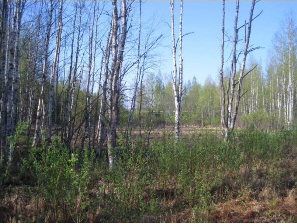
Kuva 105. Maanteiden välinen kosteikko-osa