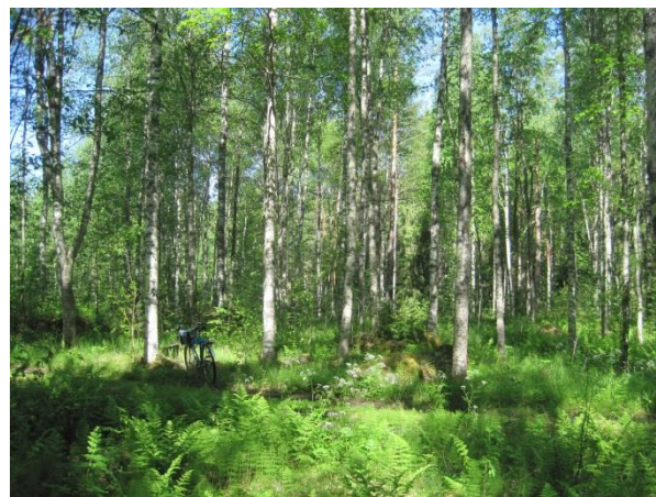
Kuva 29. Vehmasta koivikkoa Hamperinjoen varressa