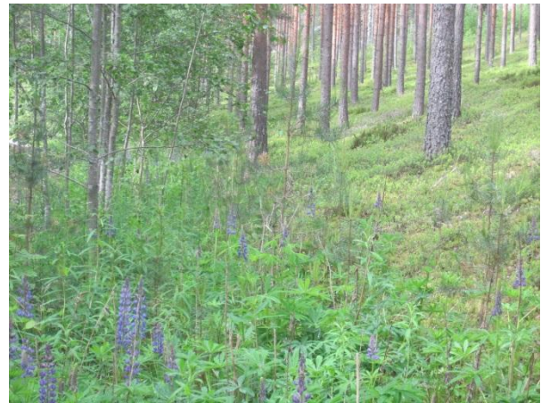
Kuva 44. Vieraslaji komealupiini valloittamassa kirkonmäen rinteitä

Kirkkola-tilan ympärillä on laaja jo varttunut istutuskoivikko, jossa keskellä isohko ulkorakennus. Kasvillisuus on rehevää ja osin vielä niittykasvillisuutta muun muassa heiniä, vadelmaa, maitohorsmaa, voikukkaa, päivänkakkaraa, poimulehtiä, metsäkurjenpolviä ja herukkaa. Koivikossa tavattiin muun muassa sirittäjä-poikue.