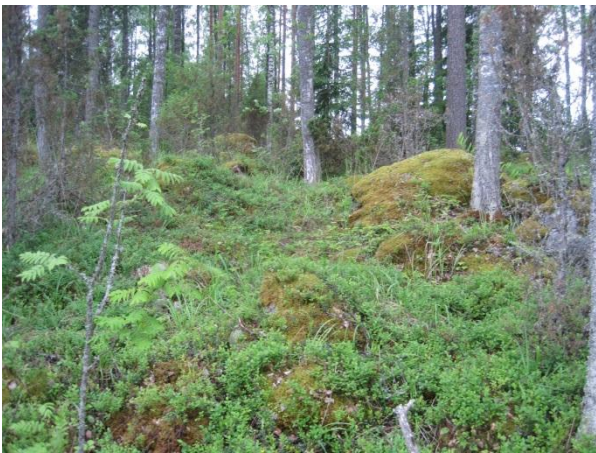
Kuva 119. Paasivuoren rinnettä Syrjälän seutuvilla

Paasivuoren etelärinteellä Niinistönahon ja Syrjälän tilojen ja peltojen välissä Paasivuori on louhikkoista metsää, joka kasvillisuudeltaan ja lähimaisemaltaan muistuttaa Päijänteen jyrkkiä ja louhikkoisia rantoja. Paasivuoren itärinteessä on kolme taloa, muun muassa Kaartee ja itälaidan Pohjoonlahden rantaan on rakennettu mökkejä. Sieltä löytyy rauhoitettu hiidenkirnu. Mökkien ja maantien välissä on pieni pelto, lehtipuustoa ja yksi kalliokumparekin. Niinistönahon ja Syrjälän metsissä kasvillisuudesta löytyy lehtokasveja: kevätlinnunherne, sudenmarja ja valkolehdokki . Alueella on aiemmin tavattu liito-oravaa , josta merkkejä löytyi myös kesän 2014 käynnillä (1.7.), vaikkakin eri kohdista kuusten ja haapojen juurelta ( liito13 ).