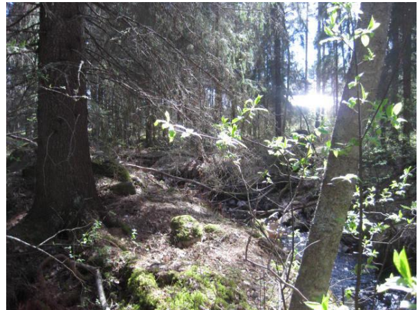
Kuva 52. Kouvolanoja Karvalin metsässä

Karvalintien varressa on pensaikon ympäröimä metsälain mukainen tärkeä elinympäristö lähde ja sen ympäristö , jossa on kasvillisuus hyvin rehevää. Lähteen ympärillä kasvaa muun muassa jokunen mänty ja koivu, pajuja, tuomi, soreahiirenporras, peltokierto Convolvulus arvensis , lehtohorsma Epilobium montanum , leskenlehti, luhtamatara Galium uliginosum , mesiangervo, suo-ohdake Cirsium palustre , huopa-ohdake, polvipuntarpää Alopecurus geniculatus sekä kastikoita että muita tavanomaisia heinälajeja. Lähteessä kasvaa runsaasti isonäkinsammalta ja tien pohjoispuolella on joskus kaivettu vesiallas, joka on täynnä isonäkinsammalta. Lähteelle on tehty ”pitkospuita”. Lähialueelle peltojen keskellä lähteen ympäristössä on myös suurempaa puustoa, koivua ja kuusia. Lähteen itäpuolella ennen Karvalia on mökkipihapiiri, jonka ympärillä on laikku isompaa puustoa, puoliavointa pensaikkoa, suuria kuusia ja istutusmetsää: koivua ja kuusta.