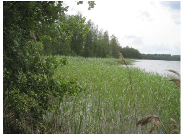
Kuva 64. Toivakan uimarannasta etelän suuntaan Saarisen rantaa

Saarisen eteläpäässä on monimuotoisuuden kannalta paikallisesti merkittäviä kasviesiintymiä (luo-1) rantavyöhykkeen harvapuustoisessa ja vaikeakulkuisessa pensaikossa. Läsän kohdalla rannassa on vesihautoja, joissa on upottavaa mutapohjaa. Vesihautoissa kasvaa runsaana punakoiso ja siellä täällä lahdenpohjukassa kasvaa jokileinikkiä. Muuta kasvillisuutta ovat halava ja muut pajut, harmaaleppä, koivu, tuomi, luhtalemmikki Myosotis scorpioides , luhtatähtimö, terttualpi, kurjenjalka, luhtamatara, rantamatara, järviruoko (myös vedessä paikoin kapea vyöhyke). Rantaan on äskettäin rakennettu pitkospuut ja kaivettu ojaa punakoisoesiintymän länsipuolella. Lisäksi rantaan on tuotu kiviä – ilmeisesti venepaikkaa varten.