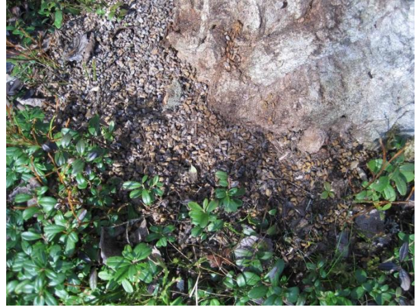
Kuva 46. Asutun pesäpuun alla on yleensä runsaasti papanoita, vanhaa (harmaat) ja uutta (kellertävä)