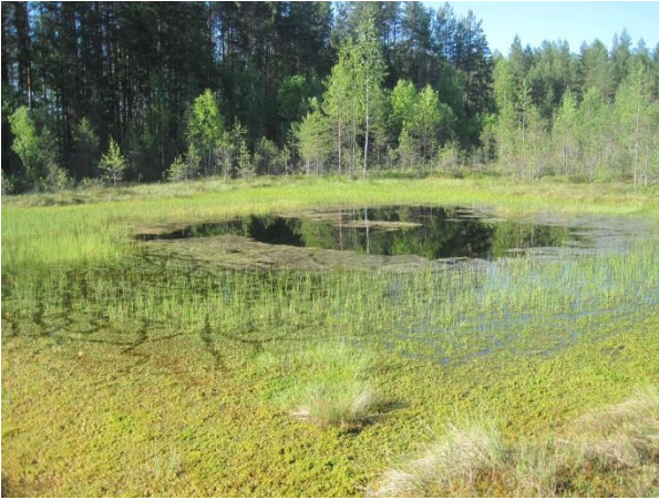
Kuva 2. Maunosensuon umpeenkasvava lampare ja oikealla taustalla rämettä.