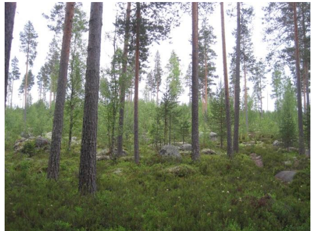
Kuva 124. Iso Kylkilammen itäpuolen karua ja kivikkoista männikköä

Tämän kaava-alueen lounaisraja on Kylkisojan kohdalla, joka laskee vetensä Iso Kylkislampeen. Kylkisojan varsi on louhikkoinen puro, jonka varressa kasvaa kivillä muun muassa haisukurjenpolvea Geranium robertianum ja lehtoarhoa. Puron varressa on liito-oravaesiintymä (23.5.2014). Papanoita löytyi usean kuusen tyveltä ( liito14 ). Aiemmin liito-oravaa on havaittu samalta alueelta ja Kylkisniitun laidasta.