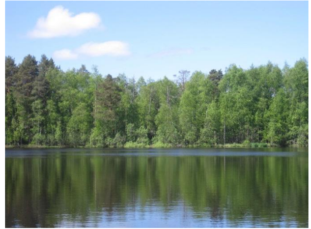
Kuva 14. Mustalampi ja taustalla länsirannan tulvametsä