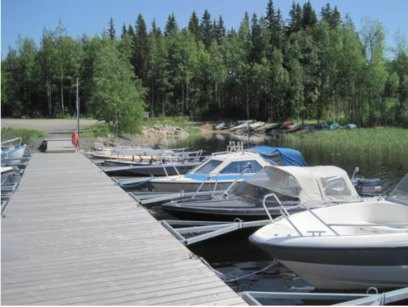
Kuva 81. Sikoviidan venesatama