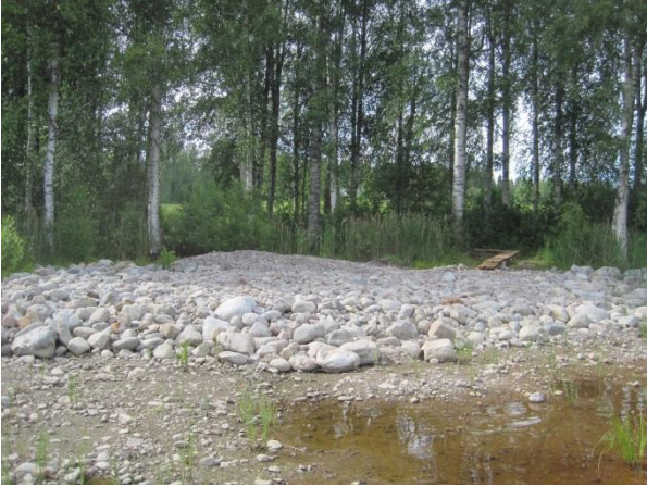
Kuva 65. Saarisen rannan pitkospuut ja tuleva venepaikka

vulgaris ja pieni esiintymä lehto-orvokkia Viola mirabilis . Ajan kanssa rannasta saattaisi tehdä mielenkiintoisia sammal- ja kääpälyttöjä. Elinympäristönä paikka sopii satakielelle Luscinia luscinia ja muille pensaikkolinnuille. Nyt nähtiin vain parvi naakkoja Corvus monedula ja sinisorsapoikue.