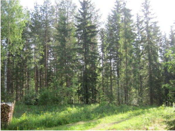
Kuva76. Raivionmäen itälaidan metsää