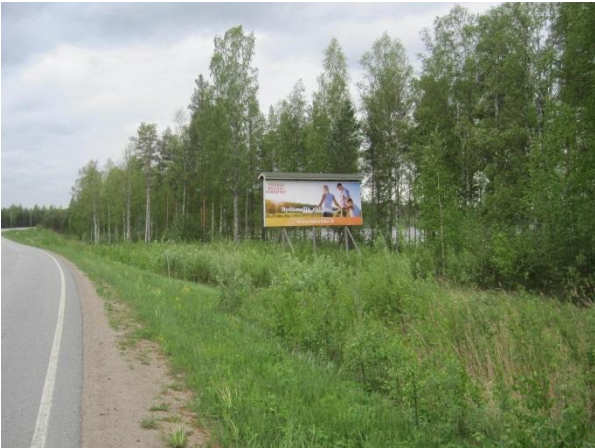
Kuva 63. Tervetulotoivotus Huikon suunnasta, taustalla Saarinen: Paikallisesti merkittävä harvinaisten kasvien kasvupaikka.