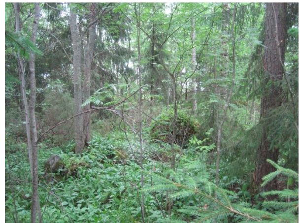
Kuva 120. Louhikkoista Pohjoonlahden rantametsää

Paasivuoresta Valtatie 4:n lounaispuolella on laajat metsäalueet ilman asutusta. Seudulta löytyy myös kolme erillistä pienalaista peltoa: Väliniitty , Järvisuon pohjoispään niitty ja Kylkisniitty . Järvisuon pohjoispään niityllä on tyypillistä kostean niityn kasvillisuutta. Heinien lisäksi sieltä löytyy yleisiä saroja, metsäalvejuuri, suo-ohdake, käenkukka ja mesiangervo. Väliniityllä on keskellä peltoa, kivikkoja ja siirtolohkareita, joiden ympärillä kasvaa muun muassa joitakin nuorehkoja koivuja ja katajaa ja päällä poronjäkäliä, sammalia, heiniä ja metsäalvejuurta. Väliniityn länsi- ja lounaispuolella on pala saniaiskorpea, jossa kasvaa suuria haapoja ja koivikkoa. Koivikossa kasvaa myös jokunen tervaleppä. Osa saniaiskorvesta on hakattu ja ojitettu. Taivaanvuohi tuntui viihtyvän tässä avoimessa ympäristössä.