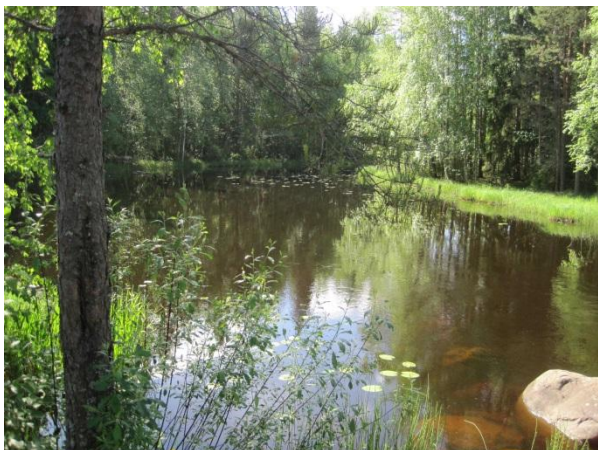
Kuva 26. Hamperinjoen alkupäätä