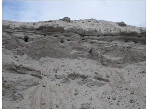
Kuva 10. Pieni törmäpääskykolonia soranottoalueella

Havulankankaan pohjoisosassa Huikontien länsipuolella on Havulankankaan pieni teollisuusalue , joka sijaitsee I luokan pohjavesialueella . Lähialueilla liikkussa teollisuusalueen toiminnan äänet kuuluivat ympäriinsä tämän kaavan pohjoisosassa, mikä on hyvä ottaa huomioon muun muassa asutusta suunniteltaessa. Havulankankaalla sijaitsee jonkin verran omakotitaloja ja muun muassa Havulan tila Mustalammen itäpuolella. Talot sijaitsevat kanerva-puolukka-mustikkatyypin mäntykankaalla.