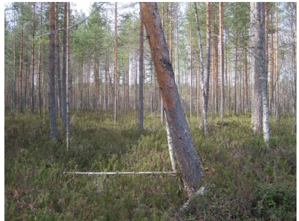
Kuva 48. Paikkalankankaan räme peltoalueen keskellä