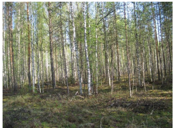
Kuva 108. Pohjoonlahden turvekangas