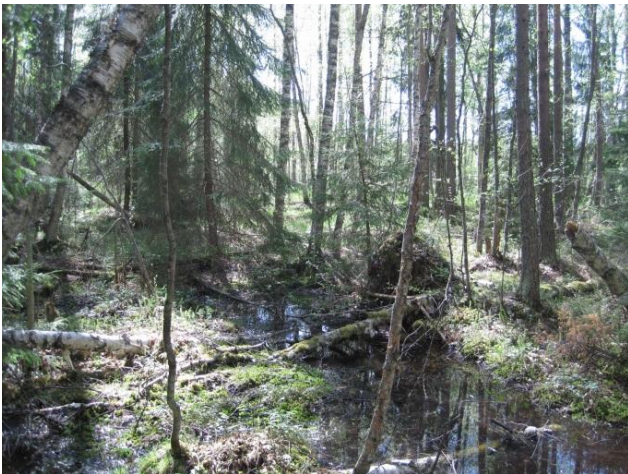
Kuva111. Hokkalan monimuotoista metsää

Reheväkasvuisten purojen väliin jää tuoretta mustikka-käenkaalityypin metsää. Tällä metsäalueella on paikoin myös nuorehkoa istutuskuusikkoa ja koillisosassa puron pohjoispuolella pieni hakkuu-aukeakin. Länsipuolen puron läheisyyteen on rakennettu kaksi uutta omakotitaloa. Lisäksi puustoa on hakattu kivikkoisen puron varresta. Tähän metsäalueeseen kuuluu myös Poikaraiskansuo .