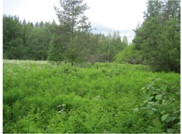
Kuva33. Harjun ja Kominojan välistä niittyä