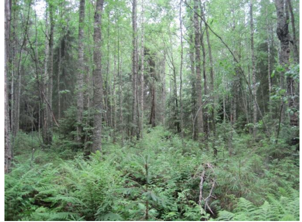
Kuva 23. Ojitettua saniaiskorpea