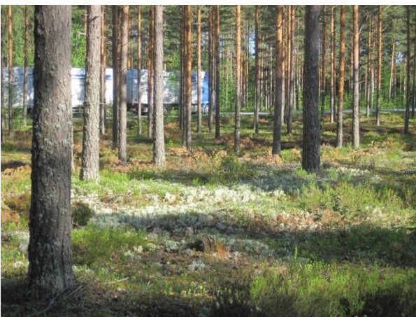
Kuva 8. Havulankangas ja rekka, Toivakan päätte (Huikontie maantie 618)

Soranottoalueen pohjoisosassa on pieni törmäpääsky-yhdyskunta (arviolta vain 5 paria, arvioitu havaittujen lintujen, ei kolojen perusteella) (Kartta: tö1). Törmäpääskykolonia tulisi ottaa huomioon tulevaa käyttöä ja maisemointia suunniteltaessa. Törmäpääsky Riparia riparia kuuluu nykyään uhanalaisluokituksen vaarantuneisiin (VU) lajeihin. Soramontuilla muita pesivinä havaittuja lajeja olivat yleiset kalalokki Larus canus , keltasirkku ja västäräkki Motacilla alba .