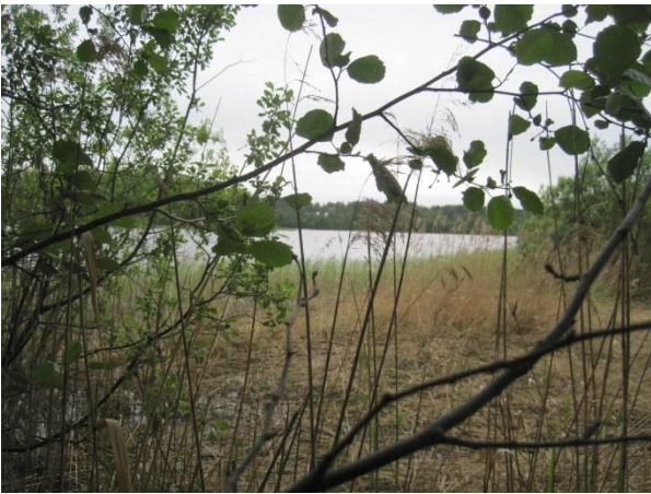
Kuva 59. Saarisen länsirannan ruovikkoa