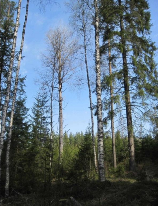
Kuva 45. Harvapuinen liito-oravan pesäpaikka

Lamminsuontien varresta molemmin puolin Kuuselan ja Suonpään väliseltä metsäalueelta löytyy liito-oravaesiintymä , jossa selkeä lisääntymispaikka haavan kolossa aivan taimikon laidassa 19.5.2014 (liito3).