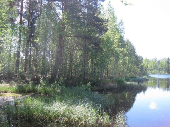
Kuva 13. Mustalammen itäranta etelään päin