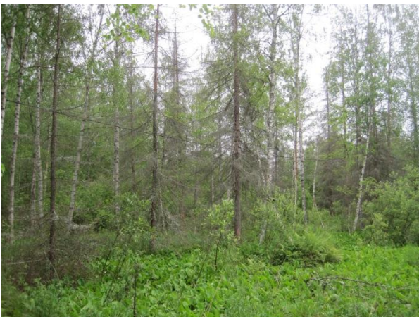
Kuva 89. Kakaravaaran lammen tulvametsää