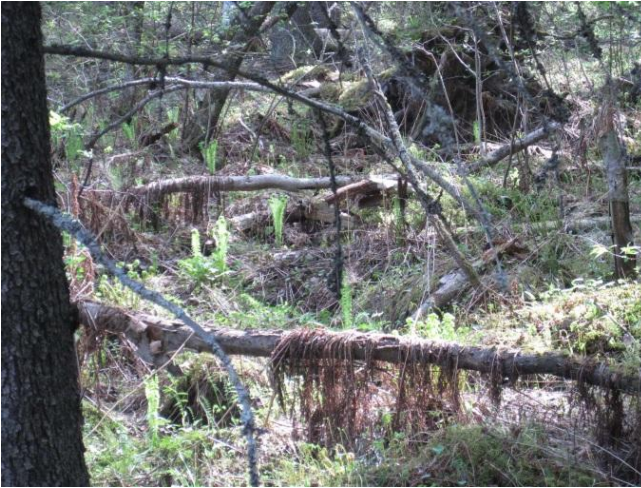
Kuva 113. Sivinmatinmutkan puron varren versovat kotkansiivet