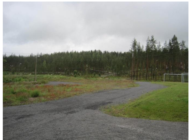
Kuva 98. Toivakan urheilupuisto ja taustalla Paikkalanvuori

Paikkalanvuoren ja Kiikarvuoren välissä kulkee monimuotoisuuden kannalta merkittävä nimetön puro Sankarisuolta (tämän kaavan ulkopuolella) Vanhan pappilan pohjoispuolitse Kakaravaaran läpi. Puro laskee Pohjoonlahteen. Puroa on kutsuttu tässä työssä Vanhan pappilan puroksi (luo1). Puro kulkee paikoin syvässä uomassa ja paikoin louhikossa. Vuorten välinen osuus puron varressa on enimmäkseen rehevää kuusikkoa, josta löytyy runsaita sanikkaiskasvustoja, haapaa ja hieman tervaleppää.