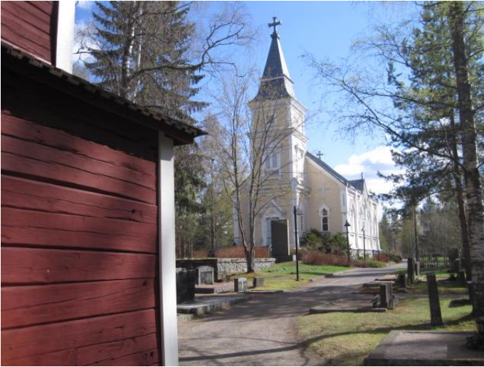
Kuva 1. Toivakan kirkko kellotapulin vierestä kuvattuna

Valtakunnallisesti arvokas rakennettu kulttuuriympäristö Toivakan puukirkko on kirkonkylän Syrjänharjulle valmistunut 1882 ja kellotapuli 1871, joita ympäröi hautausmaa.