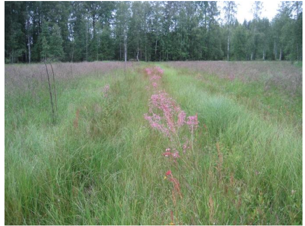
Kuva 122. Väliniityn ojan varressa kukki punaisena käenkukkaa