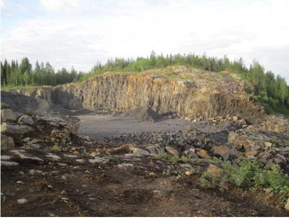
Kuva 115. Laskukallion avolouhos