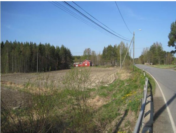
Kuva 49. Koivulehdon tila Varikontien varressa