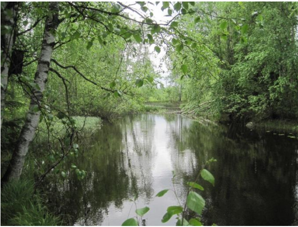
Kuva 55. Sahijoki

Sahijoen eteläpuolella on Särkän tilan peltoja; kapea puusto- tai pensaikkovyöhyke erottaa vesiuoman pelloista. Alajuoksulle mennessä Sahijoen varressa on nuorta metsää ja ihan joen varressa suurempia puita ja taimikon keskellä suuria haapoja.