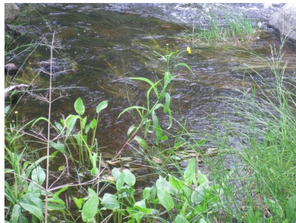
Kuva 27. Hamperinjoen varren kukkiva jokileinikki