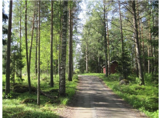
Kuva 78. Pihatie Leppävedenrannassa