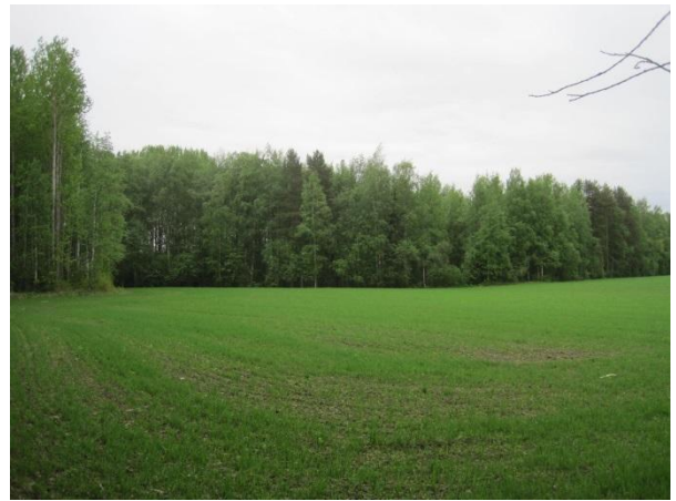
Kuva 60. Saarisen rannan rantametsää

Metsän linnustoon kuuluvat ainakin nuolihaukka Falco subbuteo , räkättirastas, punakylkirastas, mustarastas, lehtokerttu ja pajulintu.