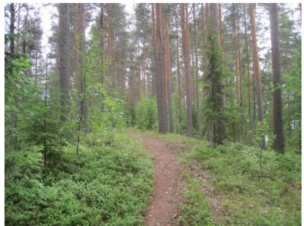
Kuva 39. Harju