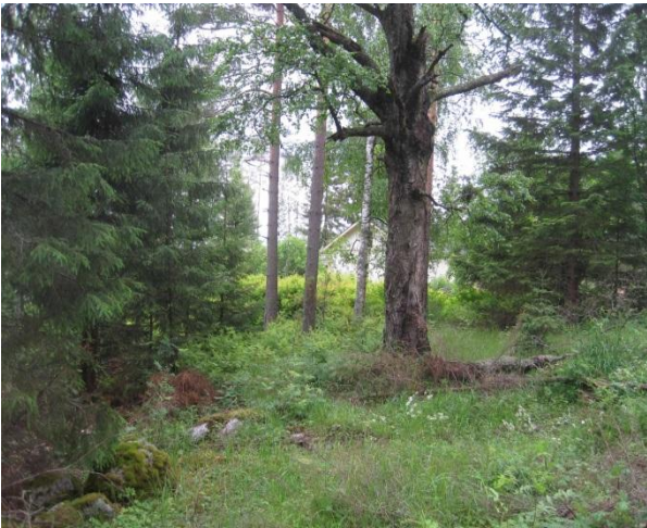
Kuva 69. Liito-oravan vakituinen levähdys- ellei peräti pesimäpuu

Ahokkaan ympäristössä on liito-oravareviiri (liito5) . Joutolantien perinnetilan (Kotikumpu?) kasvaa pihassa komeita kuusia ja pötkelöityvä koivu, jonka juurelta löytyi liito-oravan papanoita vielä heinäkuun alussa (2.7.2014)(Kuva 69.). Ympäriä oli kaadettu isoja puita. Papanoita oli sen verran runsaasti, että se viittaa pesintään koivupötkelössä. Tien toisella puolella sekametsäsaarekkeessa papanoita löytyi lähinnä suurten kuusien juurelta myös aivan talojen tonttien nurkilta. Asuintalojen pihaja ei tutkittu. Tämän metsäsaarekkeen kasvillisuuteen kuuluvat arvokkaimpina näsiä Daphne mezereum ja kevätlinnunherne.