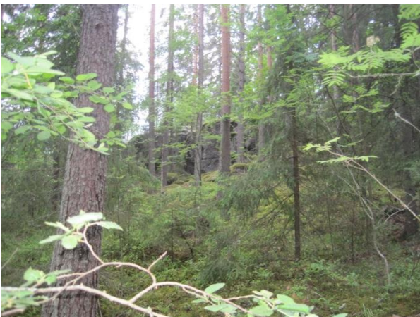
Kuva 101. Kärmevuoren pieni männikköjyrkäne

Kärmevuoren länsilaidassa Viisarinmäentien varressa on syvä vanha soramonttu, jossa kasvaa nyt tiheästi harmaaleppää. Montun reunoilla kasvaa kanervaa, poronjäkälää ja keltatalvikkia Pyrola chlorantha