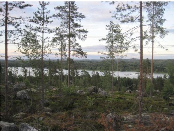
Kuva 117. Näkymä harvennetulta Paasivuorelta

Paasivuori kuuluu vain eteläosaltaan tähän osayleiskaava-alueeseen. Paasivuori on pääosin havupuuvaltaista metsäaluetta, joka kohoaa korkeimmillaan yli 166 metrin korkeuteen merenpinnan yläpuolelle ympäröivää maisemaa hallitsevasti etenkin Leppävedenrannasta päin katsottuna. Paasivuori sijaitsee vanhan Jyväskylätien (644) ja uuden valtatie 4. (E75) välissä, jonne uuden tien liikenteen melu kuuluu selvästi. Vuoren laelle kulkee metsäautotie ja rinteillä on laajalti tehty hakkuita. Vuoren eteläosa on havupuuvaltaisen puolukka-mustikkatyyppin metsän peitossa, jossa joukossa kasvaa myös lehtipuuta. Alempana rinteillä on rehevämpää käenkaali-oravanmarjatyyppin kuusikkoa. Pellon laidoissa ja tienvarsilla on enemmän lehtipuuta. Itärinteessä on karumpaa kanerva- ja poronjäkälatyyppin männikköä. Yleensäkin Paasivuori on hyvin louhikkoista ja rinteistä löytyy näyttäviä siirtolohkareita. Metsäautotien penkassa kasvoi yksittäinen valkolehdokki ja muualla metsässä kasvaa mm. metsävirnaa. Uusi valtatie 4 on louhittu Paasivuoren etelärinteeseen ja tie on varustettu riista-aidalla.