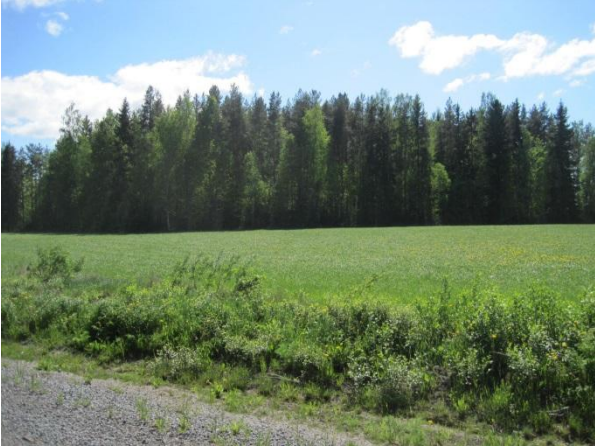
Kuva 16. Sekametsäsaareke