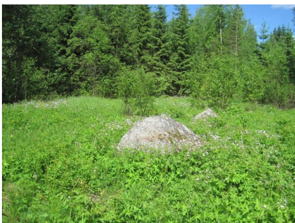
Kuva 30. Karilehdon kivikkoista niittyä