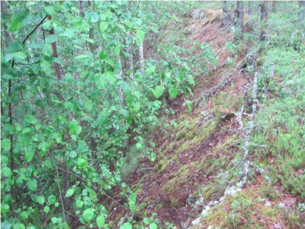
Kuva 103. Kärmevuoren pensaikkaa kasvava sorakuoppa