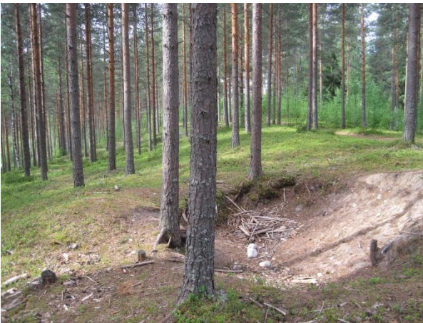
Kuva 43. Kuluneisuutta Syrjäharjulla

Toivakan kirkko ja hautausmaa sijaitsevat Syrjäharjun ehjän osan päällä. Samaisella harjukannaksella on koulu, terveystalo, kunnantalo ja lähes koko Toivakan kirkonkylän keskustaajama. Kirkon länsi- ja itäpuolella rinteet ovat puolukka-mustikkatyypin männikköä, jossa on havaittavissa kulkemisesta johtuvaa kulumista. Pihojen vaikutus lajistossa näkyy rehevöitymisellä ja vieraslajeina. Tienpientareilla ja pihojen laidoilla on pienialaisia niittyjä ja ketoja, joissa kasvaa muun muassa kataja, niittynätkelmä Lathyrus pratensis , kielo, puna-ailakki Silene dioica , hietakastikka Calamagrostis epigejos ja yleisiä heiniä. Polkujen varsissa kasvaa komealupiinia Lupinus polyphyllus , vadelmaa ja maitohorsmaa. Syrjäharjun soranottoalueen eteläpuolista männikköä on myös harvennettu.