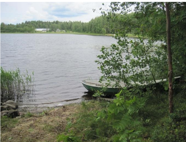
Kuva 38. Aittojärvi Harjun kärjestä kuvattuna