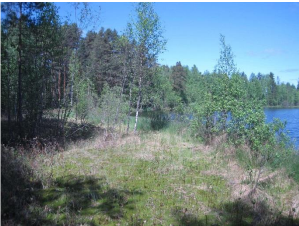
Kuva 15. Mustalammen lounaiskulman rantanevaa

Salokas ja Harjula -tilojen ympäristö on maatalousympäristöä, josta löytyy vanhoja ulkorakennuksia, laidunmaata ja peltoa sekä lehtomaisia ja tuoreita kangasmetsiä. Räkättirastas Turdus pilaris -yhdyskunnan lisäksi metsissä kuului ainakin mustapääkerttu Sylvia atricapilla , seudulla harvalukuinen kultarinta Hippolais icterina , punarinta, puukiipijä ja sepelkyyhky.