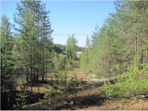
Kuva 9. Metsittyvää entistä soranottoaluetta