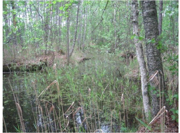
Kuva 58. Saarisen rantametsän vesiallikko