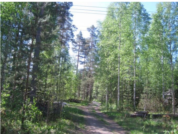
Kuva 11. Havulaan menevä pikkutie

Särkänkangas sijaitsee Saarisen rannassa Havulankankaan lounaispuolella. Särkänkankaalla on kanerva-puolukka-mustikkatyypin lisäksi heinäistä koivikkoa ja istutuskuusikkoa peltojen laidalla. Koivikossa kasvaa pensas- ja aluskasvillisuudessa ainakin pihlaja Sorpus aucuparia , kataja Juniperus communis , vadelma, metsäruusu Rosa majalis , ahomansikka Fragaria vesca , aho-orvokki Viola canina , lillukka Rubus saxatilis , kielo Convallaria majalis ja metsäkastikka Calamagrostis arundinacea . Koivikossa kasvaa myös haapaa ja harmaaleppää Alnus incana .