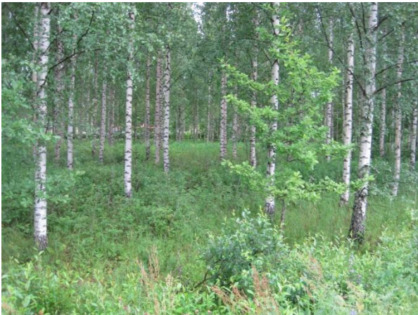
Kuva 85. Pölkin koivikkoa

Metsänhoitoyhdistyksen talon ympärillä on isoja kuusia ja lehtomaista metsän pohjaa. Kuusten juurella oli liito-oravan papanoita 2.7.2014 (osa liito5 ). Reviiri on yhteydessä Ahokkaan liito-oravaesiintymään.