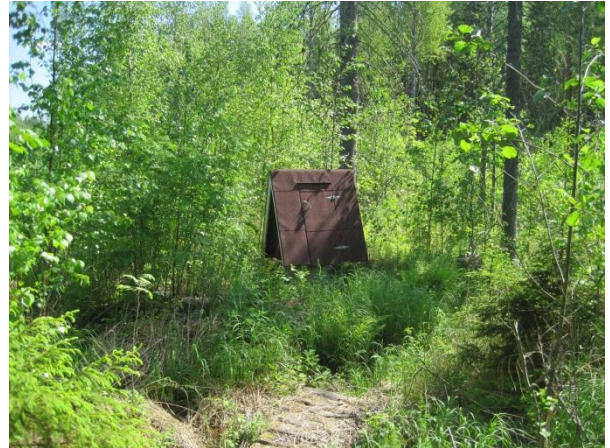
Kuva 82. Sikoviidan lähdekoppi