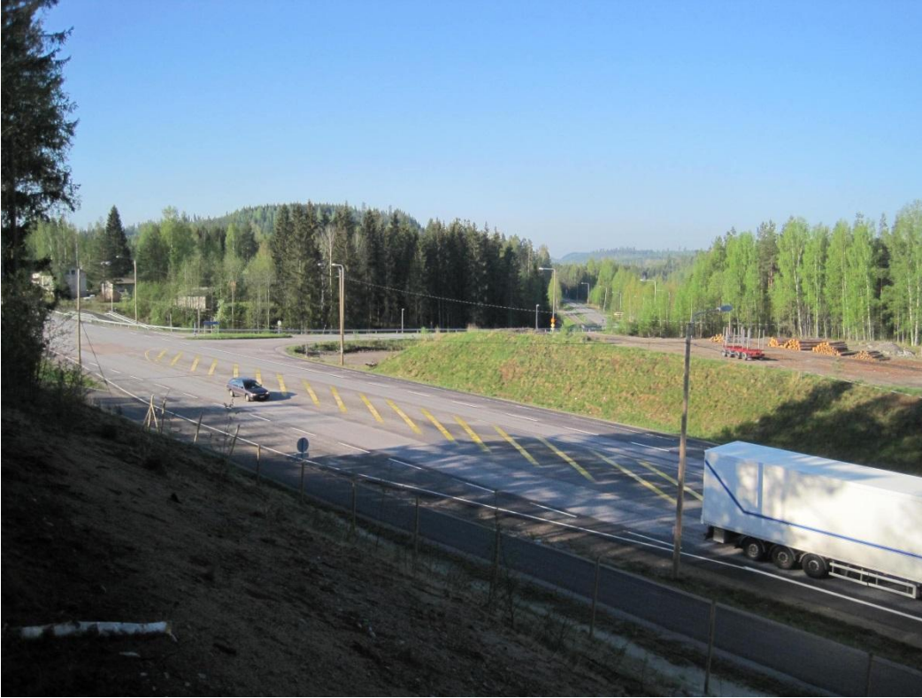
Kuva 131. Rutalahdentien risteys ja vilkas valtatie 4. Taustalla liito-oravareviiri ja sen takana vuori

Koulu sijaitsee mäellä Rutalahdentien ja uuden valtatie 4 risteysalueen eteläpuolella Baijerin laakson itälaidalla. Koulun lähetyvillä on haja-asutusta: omakotitaloja, pienialaisia metsiköitä (lähinnä nuorehkoja koivikoita) ja peltoja. Koulun läheisyydessä tieristeysalueen metsikkörinteessä on liito-oravan lisääntymis- ja levähdyspaikka (1.7.2014)(liito16, Kuva 131) . Tästä on myös aiempia havaintoja (Pylvänäinen 2011).