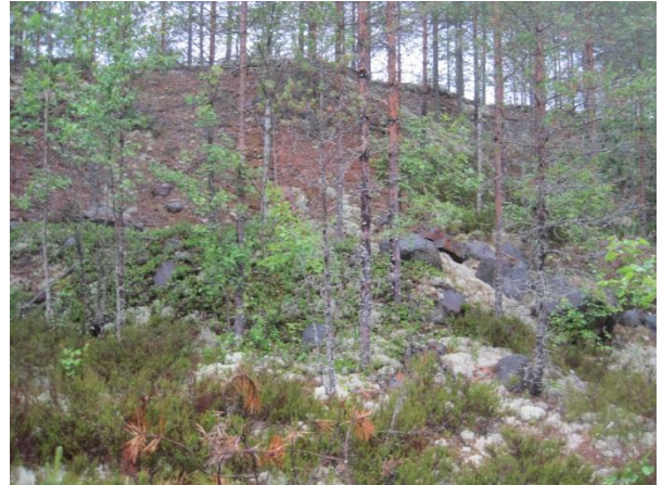
Kuva 104. Kärmevuoren maantieverren soramonttu

Torvilehto ja Oinaskangas ovat vaihtelevanikäistä tuoreempaa ja rehevämpää kuusivoittoista metsäaluetta. Metsästä löytyi pienialainen liito-oravaesiintymä (liito10) 19.6.2014. Metsän läpi menevän polun varressa on myös lehtokorpimaista osuutta, jonka luontoarvot ovat muuttuneet hakkuun ja maanmuokkauksen myötä.