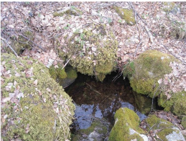
Kuva 97. Paikkalanvuoren lähde

Paikkalanvuori on vaihtelevasti poronjäkälä-, kanerva-, puolukka-, mustikkatyypin havumetsää. Pururadan varresta löytyy myös mäntytaimikkoa. Muuta louhikkoisen kankaan kasvillisuutta on muun muassa kataja, sianpuolukka, metsätähti, vanamo, metsäalvejuuri, rohtotädyke, oravanmarja ja polkusara Carex brunnescens . Paikkalanvuorella on kaksi huippua, joista eteläisempi on kalliojyrkänteinen ( luo1 ). Huipun puusto on männikköä. Rinteen alla polkujen varressa on kuusivaltaista metsää ja rehevämpää. Paikkalanvuoren lounaispuolella on taimikkoa.