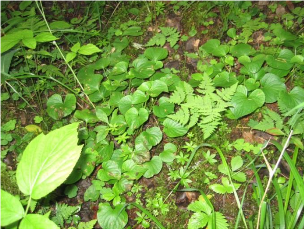
Kuva 129. Lehtomatara ja -orvokki