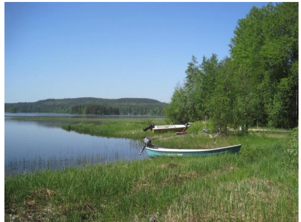
Kuva 80. Nikkarinlahden venesatama

Sikoviidan lähteen ympäristöstä ( luo1 ) on aiemmin tehty merkittäviä kasvi- ja sammallöytöjä. Lähteen ympärille on rakennettu huopakattoinen kaivokoppi ja pitkospuut. Nyt pitkospuut olivat hieman lahot. Ylempänä rinteessä kaakkoon on myös lähteisyyttä ja hieman sammalpeitteistä kivilouhikkoa. Lähteen ympärillä on rehevä kasvillisuus muun muassa ojakellukkaa, soreahiirenporrasta. Hieman kauempana rinteessä haapojen alla kasvaa rauhoitettua valkolehdokkia Platanthera bifolia ja kevätlinnunhernettä. Lähteen ja venesataman välissä on pienialainen lehtomainen sammalkivikkoinen metsäsaareke. Ympäröivä voimakas metsänhakuu on vähentänyt alueen luonnontilaisuutta. Aukolla on kolohaapoja, jossa pesi nyt käpytikka ja tervapääsky Apus apus .