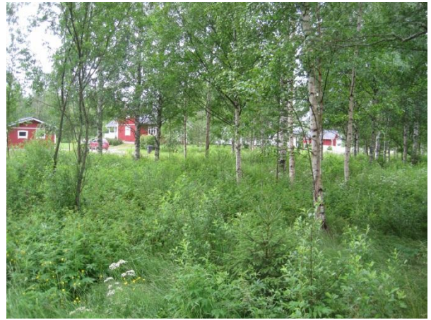
Kuva 88. Kakaravaaran asuntoalueen puronvarsikoivikko