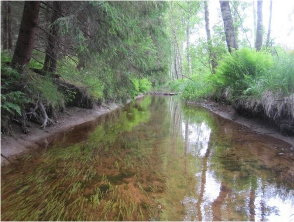
Kuva 32. Kominojan suorinta uomaa