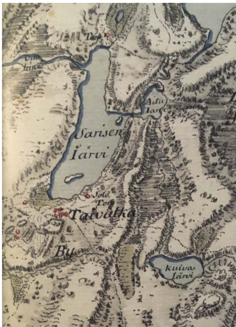
Kuva Kuninkaan kartastot Eteläsuometa 1776-1805 , karttalehdeltä 168b.

Kuninkaan kartaston mukaan Toivakan kylän kylätontti sijaitsi Saarisen eteläpuolella lähellä nykyisiä Läsän ja Pessilä tilakeskuksia. Hambergin myllyn vaiheilla näyttäisi olevan asutusta, samoin mahdollisesti Ahokkaan, Pölkin ja Salokkaan tilojen vaiheilla.