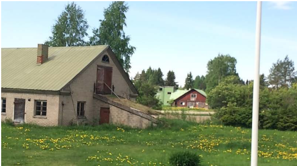
Kuvassa Vehmaan tilakeskus pilkottaa Kankaan navetan takaa.

Kankaan ja Hietalan kanssa yhtä aikaa Pessilästä isojaossa lohkottu Vehmaa sijaitsee Kankaan tilakeskuksen kanssa yhtenäisessä viljelymaisemassa. Vehmaan pihapiirin edustaa 1800- ja 1900-lukujen tilakeskusten rakennuskantaa. Perimätiedon mukaan Toivakan ensimmäinen kauppa aloitti toimintansa Vehmaan riviaitassa vuonna 1875. Vehmaan pihapiirillä on liikehistoriallista ja maisemallista merkitystä.